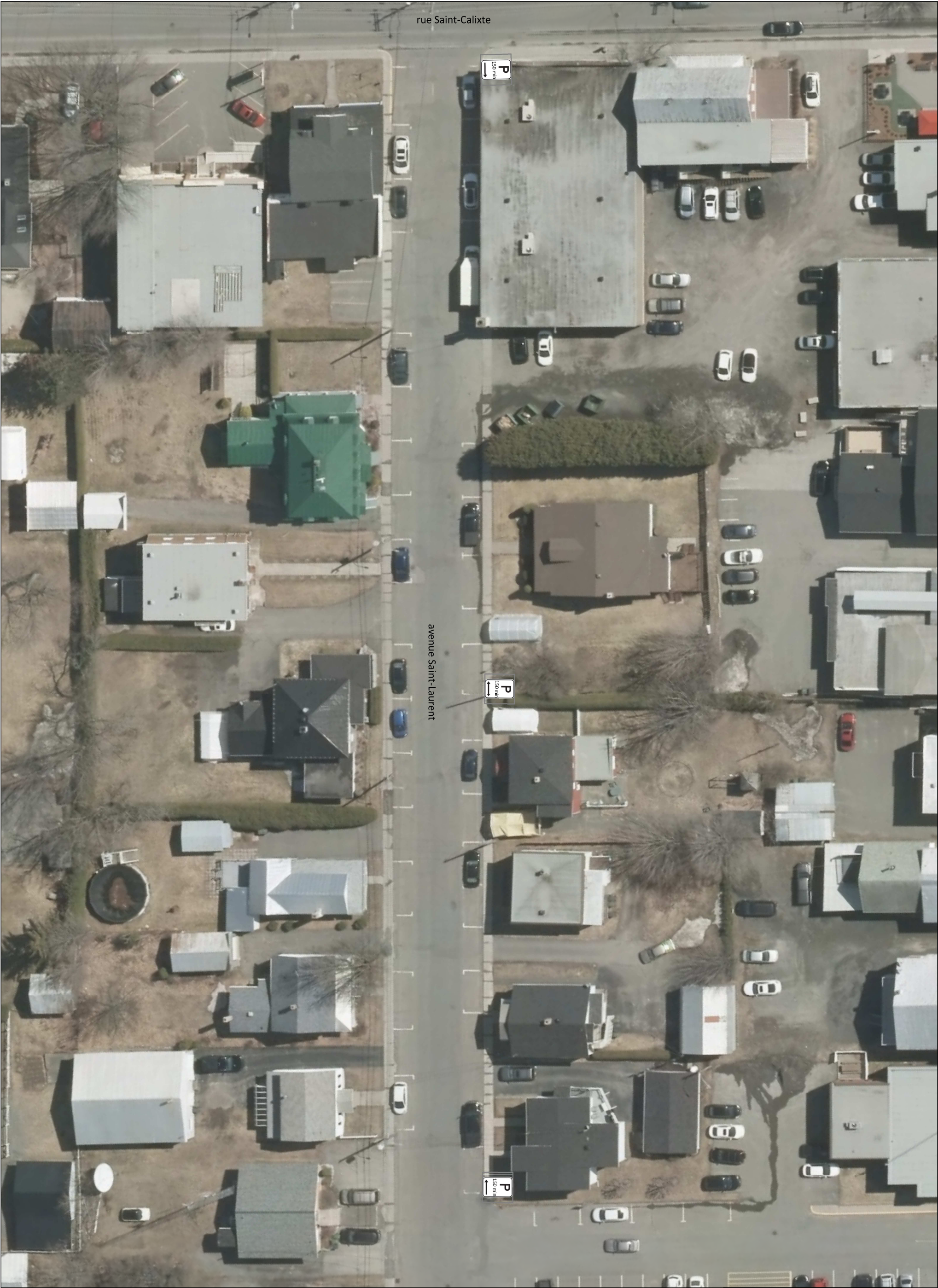
Vue de localisation